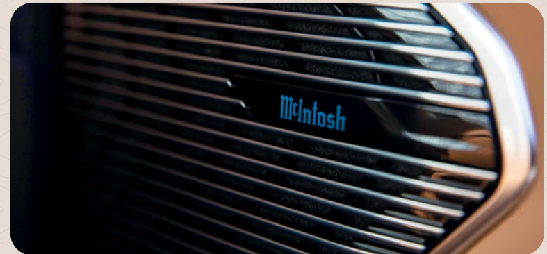
Sistema de Audio McIntosh®