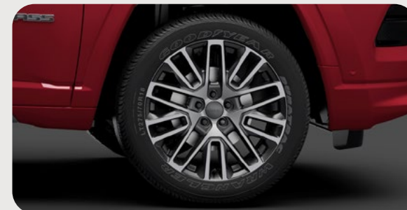
Rines de aluminio de 19"