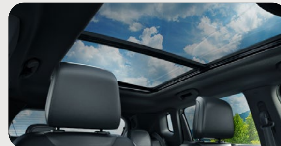
Quemacocos dual panorámico CommandView®